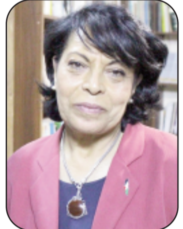
بقلم: أسماء ناصر أبو عياش

لطالما استمرنا كأدباء ومثقفين عرب دور "الضحية"، ضحية الاستعمار الذي قسم المقسم وضحية الأنظمة التي كتمت الأفواه وضحية المنظومة والإطار المجتمعي. لكن، ألم يحن