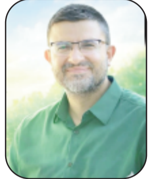
بقلم: ثامر سياحته xx مركز كن بلسم للتدريب والأبحاث - فلسطين

الجديدة بقضية الأسرى وتعزيز الوعي بها. إن عائلات الأسرى ليست مجرد متلقية للألم، بل صانعة للأمل، وقادرة على تحويل معاناتها إلى قوة دافعة نحو التغيير. فحين تصر الأم على رفع صورة ابنها في كل ساحة، وحين يواصل الأب طرق كل باب، فإنهم لا يطالبون فقط بحرية أحبّتهم، بل يكتبون فصلاً جديداً من فصول الصمود الفلسطيني. وفي زمن تتكاثر فيه التحديات، تبقى هذه العائلات خط الدفاع الأول عن إنسانية الأسرى، وحلقة الوصل التي تمنع قضيتهم من الغياب، لتبقى حاضرة في الضمير - حتى الحرية.