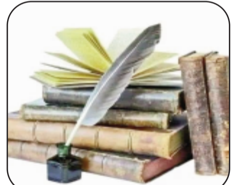
بقلم: الأء أكرم العقاد