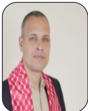
بقلم: وسام زهير - غزة

ليست قضية الأسرى الفلسطينيين في سجون الاحتلال مجرد ملف حقوقي عابر، بل هي مرآة مكثفة لطبيعة الصراع، حيث تتحول الأجساد إلى ساحات اشتباك، والحرية إلى معركة يومية ضد منظومة قمع ممنهجة. فمنذ عقود، يتنقل الأسير الفلسطيني بين سياسات متعددة، تبدأ بالاعتقال الإداري ولا تنتهي عند حدود التهديد بإقرار أو