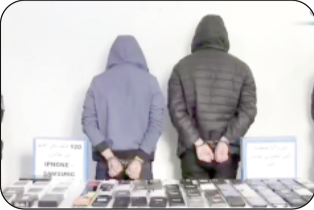
..أمن قسنطينة يوقف ناشطتين على تكتوك

وبعد الانتهاء من مجريات التحقيق، تم تقديم المعنيتين أمام النيابة المحلية لدى محكمة الخروب وفق ملضي إجراءات جزائية.