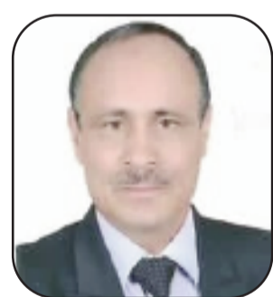
بقلم: شريف إبراهيم أحمد - مصر

في الزنازين، لا أحد يتألم وحده.. حين يمرض أسير، لا