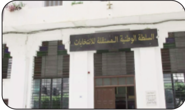
والضغالة، وفق ما تقتضيه السالف الذكر، وفقا للمصدر الأحكام الجديدة للقانون ذاته.

وضعت السلطة الوطنية المستقلة للانتخابات بريدًا إلكترونيًا تحت تصرف الأحزاب السياسية والقوائم الحرة، للتكفل بانشغالاتهم المتعلقة بالانتخابات التشريعية المقررة في 2 جويلية المقبل، حسب ما أفاد به، بيان لذات الهيئة.