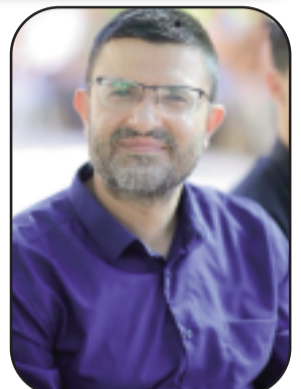
بظم: ثامر سباعنه / مركز كن بلسم للتدريب والأبحاث - فلسطين

في ظل تصاعد التوترات الإقليمية، ومع اندلاع الحرب على إيران، عاد الاحتلال الإسرائيلي ليوظف ذريعة "الدواعي الأمنية" لتبرير إجراءات قمعية جديدة، كان أبرزها إغلاق المسجد الأقصى