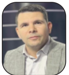
بظم: د. رائد ناجي

في كل مجتمع عظيم صوت لا يرضى بالانصياع لصدى العادي ومنحني المألوف، صوت ينبش في الذاكرة والحقيقة والوجدان ليحضر أعماق معنى في لحظة الانسان. رابع خدوسي، الأديب الجزائري الذي ولد بين جبال الأطلس البلدي، لم يكن مجرد كاتب ينظم الكلمات في صفحات، بل كان ظاهرة ثقافية وفكرية صنعت في داخله الاتحاد بين السقسوة والجمال، بين الألم والبهجة، وبين التاريخ والخيال.