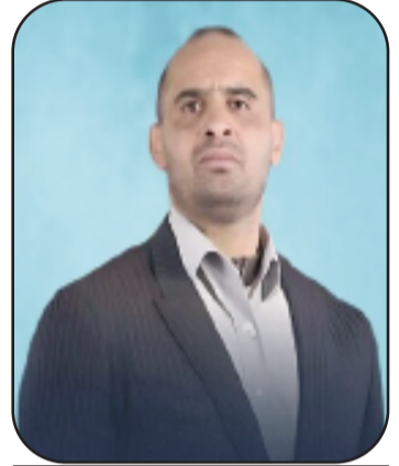
يقلم: بن معمر الحاج عيسى - الجزائر

في الثالث عشر من آذار من كل عام، يحتفل الفلسطينيون في الوطن والشتات بيوم الثقافة الوطنية الفلسطينية. وهو يوم ميلاد الشاعر الفلسطيني الراحل محمود درويش (Google Support)، ذلك الرجل الذي جعل من القصيدة وطناً حين سلب منه الوطن. غير أن هذا اليوم ليس احتفالاً بالمعنى الذي نقيمه الأمم المستقرة في حدودها الآمنة، بل هو تأكيد سنوي على فعل مقاومة صامت وعميق، يجري في الأوردة الثقافية لشعب لا يزال يحارب في أرضه وهويته وذاكرته في آن واحد. الثقافة في السياق الفلسطيني ليست ترفاً فكرياً ولا نشاطاً على هامش الحياة السياسية، بل هي الخط الأمامي في معركة الوجود ذاتها. منذ عقود، أدرك الفلسطينيون ما يفهمه كل شعب مستعمر في التاريخ: أن المحتل لا يكتفي بمصادرة الأرض، بل يسعى إلى مصادرة الذاكرة أيضاً. يوم الثقافة الوطنية الفلسطينية هو يوم للحفاظ على الهوية الثقافية الفلسطينية، إرث الأجداد الضارب بجذوره عبر التاريخ، وحمايته من محاولات