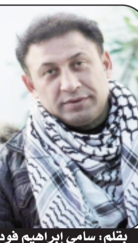
بقلم: سامي إبراهيم فودة