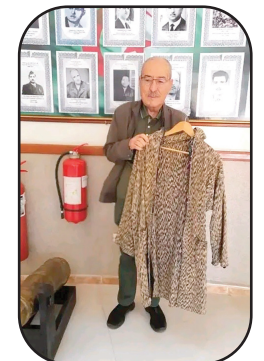
تم، الثلاثاء، عرض "قشائية" العقيد عميروش آيت حمودة (1926-)

قائد الولاية التاريخية الثالثة (1959)، خلال الثورة التحريرية المجيدة، أمام الجمهور بالمتحف الجهوي للمجاهد بتيزي وزو، بمناسبة إحياء اليوم الوطني للطلاب. وأوضح مدير المتحف، شعيان حمشة، لوكالة الأنباء الجزائرية، أن المجاهد سليمان لعيشور قام بتسليم هذا الإرث التاريخي الثمين رسميا إلى المتحف، بحضور نجل العقيد عميروش، السيد نور الدين آيت حمودة. وجرى عرض هذا اللباس التاريخي بمناسبة إحياء ذكرى 19 مايو، وهو تاريخ يكتسي أهمية خاصة، إذ يتزامن مع الاحتفال باليوم الوطني للطلاب، الذي يعتبر محطة بارزة لنقل شعلة الذاكرة للأجيال الصاعدة.