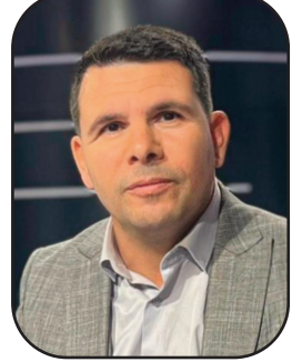
بقلم: د. راند ناجي الجزائر

والى مساحة يعيد فيها الفلسطيني اكتشاف نفسه، وكتابة وعيه، وصناعة يقينه بأن الحرية ليست حالة جغرافية فقط، بل حالة داخلية أيضا. إن التحدي الأكبر الذي يواجهه الأسرى اليوم، لم يعد مقتصرًا على القيد المادي وحده، بل أصبح يتمثل في الحرب النفسية المركبة التي تستهدف الإنسان من الداخل. فالاحتلال يدرك جيدا أن الجسد يمكن تقييده بالأسلحة، لكن الوعي الحر أخطر من كل البنادق. ولذلك، تتجه سياسات السجون الحديثة نحو إنهالك الأسير نفسيا، عبر العزل الطويل، والحرمان من الزيارة، والتجويع، والإهمال الطبي، والتصديق على التعليم، ومصادرة أبسط تفاصيل الحياة الإنسانية. الأسير الفلسطيني لا يواجه سجنا واحدا، بل يواجه منظومة كاملة صممت بعناية لتقول له كل يوم: "أنت الصمود الحقيقية؛ لأن أخطر ما يمكن أن يتسلل إلى الإنسان داخل العتمة، ليس الخوف، بل الشعور بالتسيان. ولهذا، يصبح التمسك بالتفاصيل الصغيرة شكلا من أشكال المقاومة.