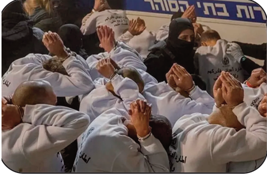
• إجبار الأسرى على الركوع أثناء إطلاق الرصاص المطاطي بشكل عشوائي وإصابة أسرى. "العدد" وعمليات التفتيش.