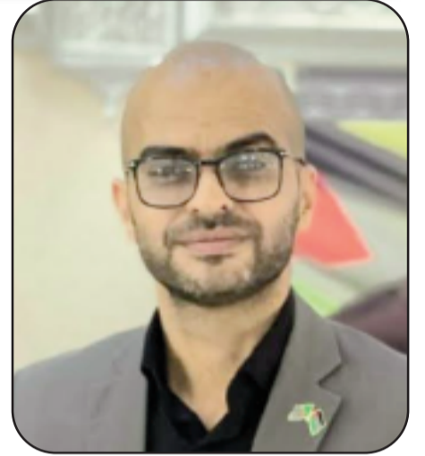
بقلم الناشط الحقوقي الفلسطيني أ. شريف الصياغ

أدانت منظمات حقوقية دولية هذا التوجه، وعلى رأسها منظمة العفو الدولية وهيومن رايتس ووتش، حيث اعتبرت أن المشروع يشكل انتهاكاً جسيماً للحق في الحياة،