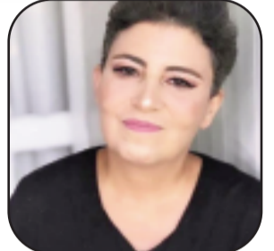
بِئَلَم: رائية قواد مرجية

ليست المسافة بين الطيبة والسذاجة خطأً رفيعاً كما يُشاع، بل خطأً دقيقاً في ميزان الوعي، انحرافاً غير مرئي، لكنه كفيل بأن يُحوّل الفضيلة إلى قابلية للاستنزاف، والقلب المفتوح إلى مساحةٍ مستباحة. الطيبة في تعريفها الأكثر دقة، ليست انفعالاً عاطفياً، بل موقفاً معرفياً. إنها اختيار يتخذ بعد الفهم، لا قبله، الطيب ليس من لم يختبر القسوة، بل من اقترب منها بما يكفي ليدرك بنيتها، ثم رفض بنوع من السيادة الداخلية أن يعيد إنتاجها، بهذا