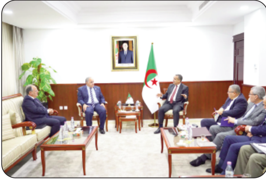
غلوبل أفريكا تيك

استقبل وزير الطاقة والطاقت المتجددة، مراد عجال، الأحد بالجزائر العاصمة، الأمين العام لمنظمة الدول الإفريقية المنتجة للنفط، فريد غزالي، حيث بحث الجانبان آفاق التعاون الثنائي، حسبما أفاد به بيان للوزارة.