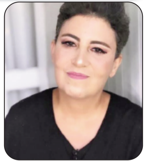
بقلم: رانية فراد مرجية

ليس من الدقة أن نضع يوم الأرض في خانة "الذكريات". الذكرى تفترض أن الحدث انتهى، وأن ما تبقى منه هو أثر يستعاد. لكن 30 آذار يقاوم هذا المصير؛ إنه لا يستعاد لأنه لم يغادر الحاضر أصلاً. ما حدث في 1976 لم يغلق كصفحة، بل ظل مفتوحاً كجرح يتغير شكله، لا عمقه. في ذلك اليوم، لم يكن الفلسطيني يحتاج فقط على مصادرة أرض، بل كان يواجه فكرة كاملة: أن المكان يمكن أن يعاد تعريفه من دون أهله، وأن