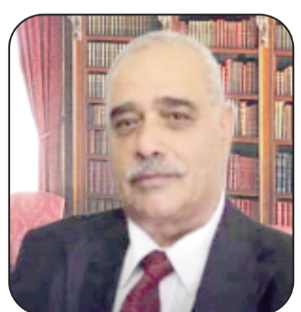
بقلم: أحمد عيسى

جدوى ما نكتبه وما نوثقه وما نخترنا أن نصمت عنه. لقد التقطت يا شاعرتنا الكبيرة خيطاً دقيقاً بين التاريخ بوصفه سرداً، وبين الوعي بوصفه مسؤولية، وصفت منه نصاً يضح بالحياة والاحتجاج والكرامة. وما يميز هذه القصيدة أنها لا تتوجه إلى المؤرخين فقط، بل إلى ضمير الأمة كله، ولكن بأسلوب يجعل الباحثين في الواجهة، وكانها تضع المرأة أمام أقلامنا وتقول: "هل كتبتم ما يجب؟ أم اكتفيتم بسرد ما حدث؟" وهذا يحذ ذاته قمة الوعي الأدبي، حين يتحوّل الشعر إلى محكمة أخلاقية لا قاضي فيها إلا الحقيقة. لقد قدّمت أيتها المتألقة شعراً بليغاً يمتاز بثلاث خصال نادراً ما تجتمع في قصيدة احتجاجية: -أولاً- لغة عالية دون تكلف كتبت بلغة عربية متينة تستدعي التراث، لكنها لا تسقط في فخ التقليد؛ بل تمنحه